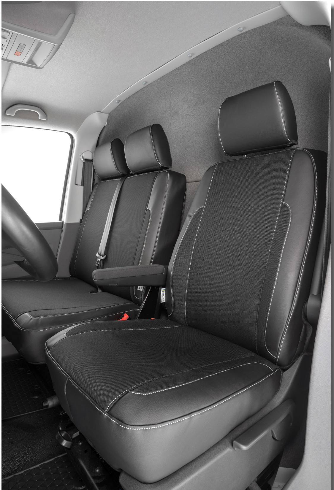
Mallikohtainen istuinsuoja, jossa yhdistyy vahva kulutusta kestävä kangas sekä keinonahka.