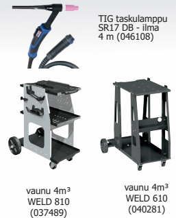
vaunu 4m 3 WELD 810 (037489)