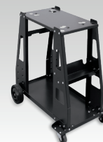
PLASMA 600-kärry 040298