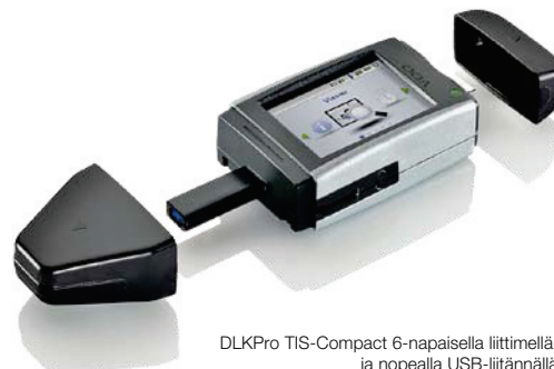
DLKPro TIS-Compact 6-napaisella liittimellä ja nopealla USB-liitännällä