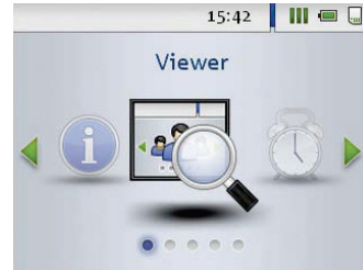
Tietojen katselu laitteessa

DLKPro TIS-Compactin tilausnumero: A2C59515262