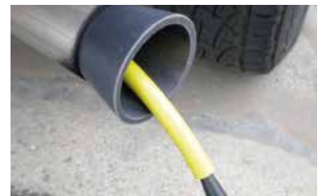
Leakfinder-savukoneen avulla voidaan myös pakoputkiston vuodot paikantaa