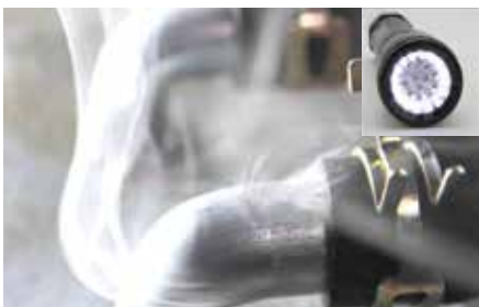
Valkoinen valo helpottaa pakokaasujen erottamista

Lisäksi Leakfinder-savukoneeseen voidaan hankkia 7 barin esipaineeseen asetettu happikaasusäädin, jonka myötä laitteen kanssa voidaan käyttää suurempaa happipulloa. Liittämiseen laite tällöin tarvitsee sylinteriletkun, jonka voi hankkia lisävarusteena.