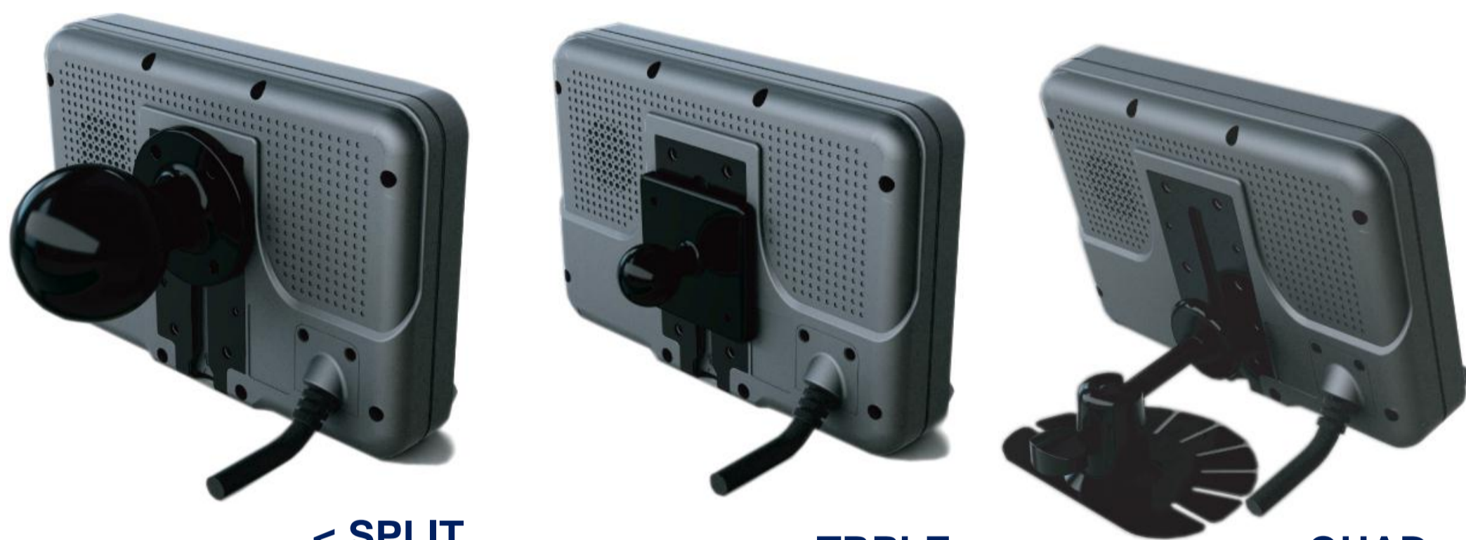
< SPLIT MODE >