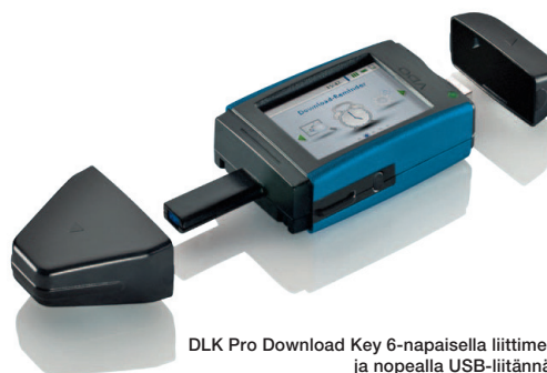
DLK Pro Download Key 6-napaisella liittimellä ja nopealla USB-liitännällä