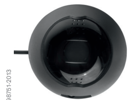
Dräger Interlock® 7000 -kamera

Interlock 7000 -ohjauksyksikön muistiin mahtuu jopa 10 000 kuvaa – jos kamera katoaa tai vahingoittuu, kaikki tärkeät kuvat ovat turvassa. Kuvat on suojattu erityisellä koodauksella. Myös kameran ja Interlock 7000:n välinen viestintä on turvalisesti salattu. Kuvat voidaan siirtää kamerasta kahdella tavalla: Interlock 7000:n infrapunaliitännän kautta tai vaihtoehtoisesti bluetoothin avulla, joka mahdollistaa erittäin nopean tiedonsiirron. Tätä tarkoitusta varten Drägerillä on erityinen Interlock 7000 -ohjelmisto, Interlock Manager. Kamerasta siirretyt tiedot ovat valtuutettujen henkilöiden käytettävissä.