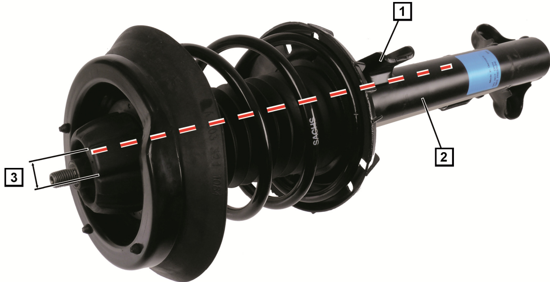
Kuva 1: Joustintuki