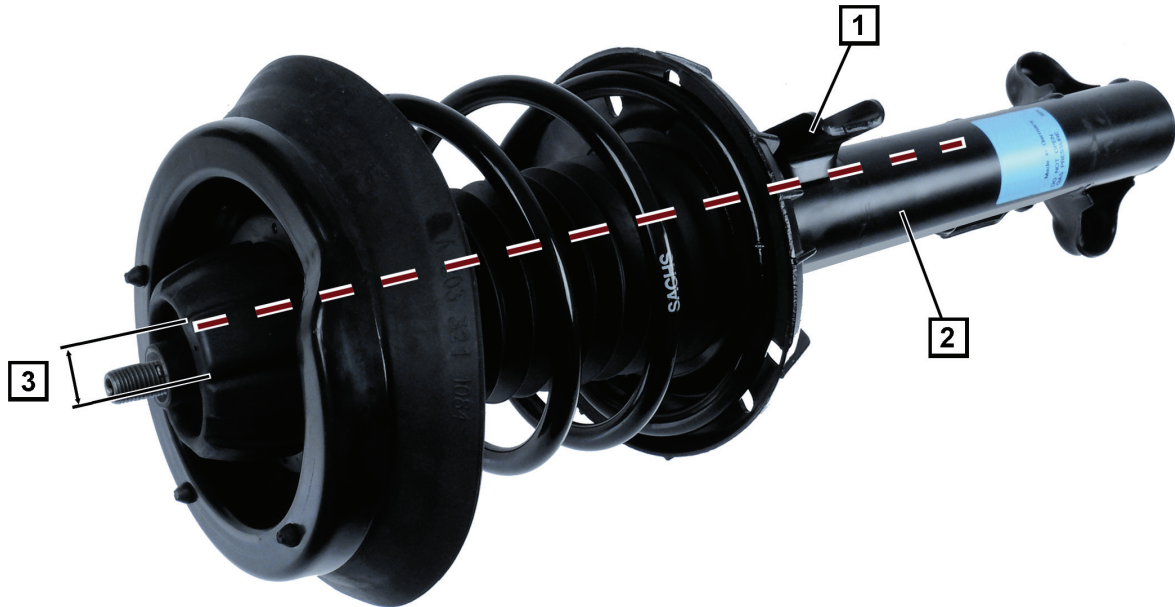
Kuva 1: Joustintuki